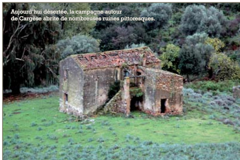
Aujourd'hui désertée, la campagne autour de Cargèse abrite de nombreuses ruines pittoresques.

Cette relative bonne entente cessa toutefois après la révolte des Corses contre Gênes, en 1729, lorsque les Grecs refusèrent de prendre les armes contre leurs bienfaiteurs. Les propriétés grecques furent alors pillées et le village de Paomia incendié. En 1731, les Grecs se réfugièrent dans la tour d'Ominia, après une ultime attaque, et réussirent à embarquer pour Ajaccio, où ils restèrent jusqu'en 1774, dans des conditions de vie assez déplorables. Ils acceptèrent alors de quitter Ajaccio, pour habiter le village de Cargèse, construit à leur attention par le Comte de Marbeuf, avec l'argent de la couronne française. Mais la révolution française, 15 ans plus tard, et le décès de Marbeuf allaient remettre en question la présence de ces "étrangers" dans la région. Attaquée par les montagnards des environs, la population de Cargèse trouva refuge dans les tours génoises de part et d'autre de la plage du Cargèse, avant de s'exiler une nouvelle fois à Ajaccio. Ils revinrent en 1797, puis, de nouveau victimes d'un soulèvement corse, repartirent en exode vers Ajaccio en 1814, avant de regagner Cargèse en 1829 et d'obtenir enfin l'assurance de pouvoir s'y établir définitivement. Le 29 mars de cette année, une ordonnance de Charles X prescrivit la construction d'une église latine au côté de l'église grecque déjà bâtie : ce fut le point de départ d'une intégration effective, acceptée de tous.