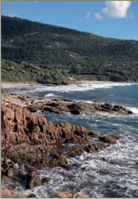
La côte rocheuse aux abords de Cargèse (vue depuis l'Institut d'études scientifiques).

endure une terrible épidémie de peste (1348).